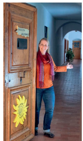
Blick ins ehemalige Kapuzinerkloster.

6.5., 10.00–17.00, Details: sonnenhuegel.org > Aktuelles