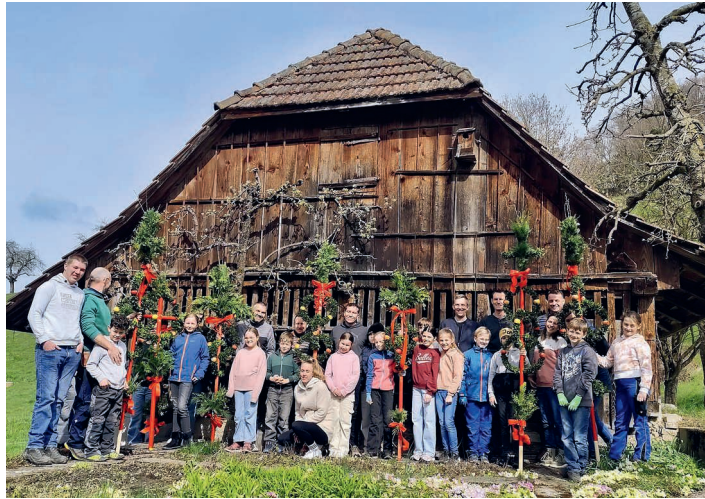
Stolz werden die gemeinsam erstellten Palmen präsentiert.

Die Erstkommunion fand nach Redaktionsschluss statt. Bericht und Bilder dazu finden Sie auf der Webseite.