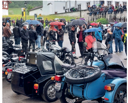
Verregnet: an der Töffsegen vom vergangenen Jahr in Altishofen.

Töffsegenungen sind für die Freund:innen der motorisierten Fortbewegung auf zwei Rädern Fixpunkte zur Saisoneroöffnung. Im Kanton Luzern gibt es jeweils zwei solche Feiern, in Altishofen und Aesch.