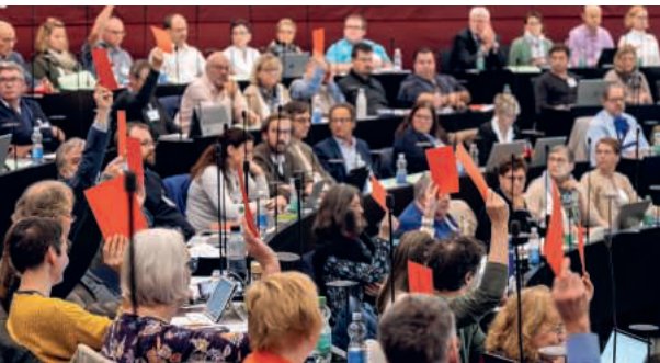
Das Kirchenparlament, die Synode, tagt im Kantonsratssaal in Luzern.

Mi, 6.5., ab 9.30, Kantonsratssaal Luzern